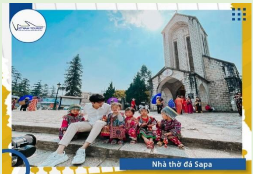
Nhà thờ đá Sapa