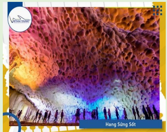
Hang Sừng Sốt