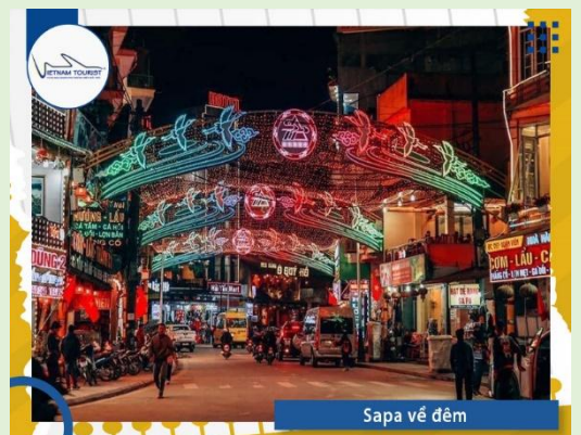
Sapa về đêm