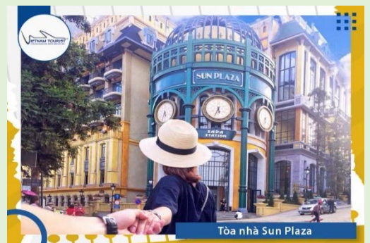
Tòa nhà Sun Plaza