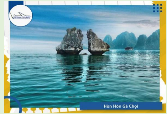
Hòn Hòn Gà Chọi