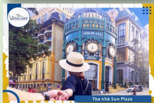
Tòa nhà Sun Plaza