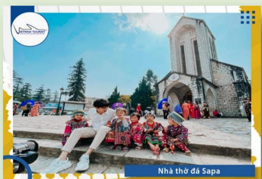
Nhà thờ đá Sapa

17h00: Quý khách đến check in Sun Plaza Sapa – Ngã tư Paris hoa lệ giữa khung trời Sapa hùng vĩ. Tại đây quý khách check-in “tháp đồng hồ mới keng” như đang ở đường phố