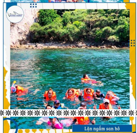
Lặn ngắm san hô