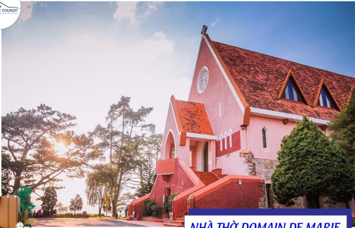
NHÀ THỜ DOMAIN DE MARIE

17h00: Xe đưa quý khách đến nhà hàng dùng bữa tối với thực đơn Buffet rau Đà Lạt