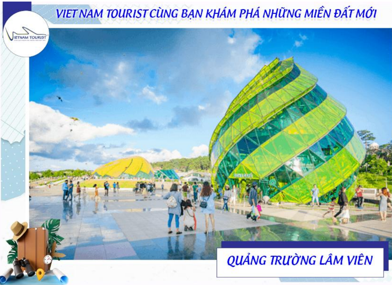
QUẢNG TRƯỜNG LÂM VIÊN

16h00: Xe đưa quý khách đến với Quảng Trường Lâm Viên . Đây là một trong những địa điểm vui chơi thú vị, hấp dẫn nhất tại Đà Lạt. Quảng trường được thiết kế và xây dựng thành 4 khối công trình lớn nhỏ khác nhau, bao gồm: công trình nhà hát, khu quảng trường và công viên, khu thương mại và dịch vụ. Điều khiến du khách và các bạn trẻ yêu thích nhất tại quảng trường này chính là những góc chụp hình sống ảo cực chất. Đứng ở bất kỳ vị trí nào tại đây bạn cũng có thể săn cho mình những bức ảnh đẹp nhất.