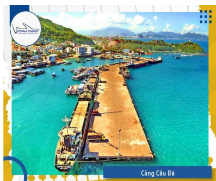
Cảng Cầu Đá

08h00: Đến Cảng Cầu Đá , quý khách di chuyển xuống cảng để cùng hòa mình vào không khí mát mẻ với chương trình du ngoạn Vịnh Nha Trang . Trên hành trình di chuyển, Quý khách có thể chiêm ngưỡng khu biệt thự An Viên, Vinpearl, Làng Chài, Hòn Miếu ...cảm nhận vẻ đẹp các bãi tắm mà thiên nhiên đã ưu đãi ban tặng cho Nha Trang. Ngang qua Làng Chài , Quý Khách lên Bè tham quan cách đánh bắt nuôi Hải Sản của người dân, có thể mua Hải Sản tự nhiên, chế biến ngay tại chỗ và thưởng thức ngay tại bè.