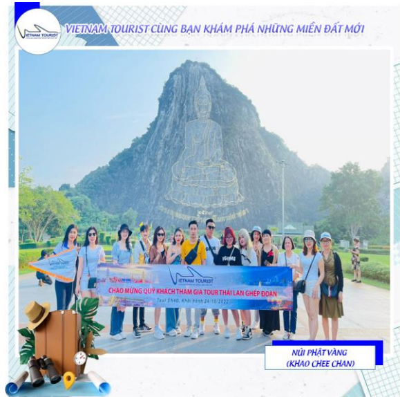
NÚI PHẬT VÀNG (KHAO CHEE CHAN)

Phật khắc vàng trên lưng núi. Mẫu tượng Phật Thích ca dát vàng cao 118 m được khắc lên núi Khao Chee Chan được tạo theo phong cách Sukhothai, được người thái ưa chuộng trên toàn quốc. Tượng Phật cao 130 mét, chiều rộng 70 mét, được xây dựng vào năm 1996, tổng chi phí xây dựng 161,7 triệu Baht được sự chăm sóc và bảo quản của quân đội hoàng gia Thái Lan.