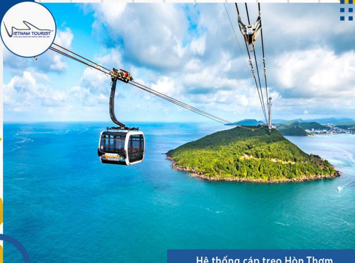
Hệ thống cáp treo Hòn Thơm

16h30: Xe đưa quý khách đến với SUNSET SANATO để thu về những bức ảnh “triệu like”